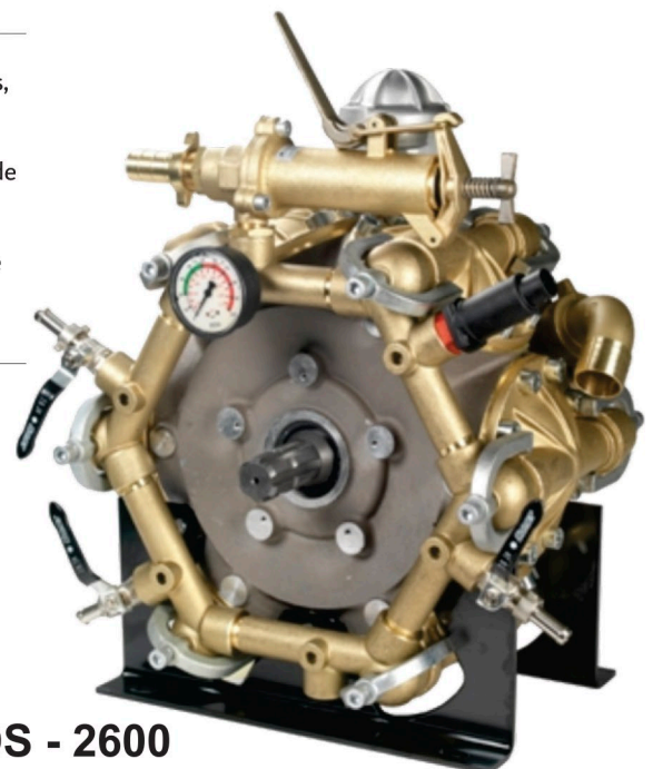
IDS - 2600

Bombas de Membranas, robustas de fácil mantenimiento, partes de contacto con el agroquímico en bronce