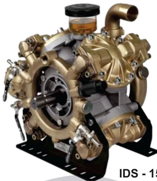
IDS - 1501

Bombas de Membranas, robustas de fácil mantenimiento, partes de contacto con el agroquímico en bronce